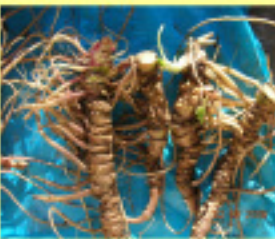
निपवाकनी ध्यालेरियाना तिको मुगन्धबाल पाउने स्थानमा पाइन्छ र योलेनदे मिमलउने रविन र्, तर यो मिमलउता हुनेन ।